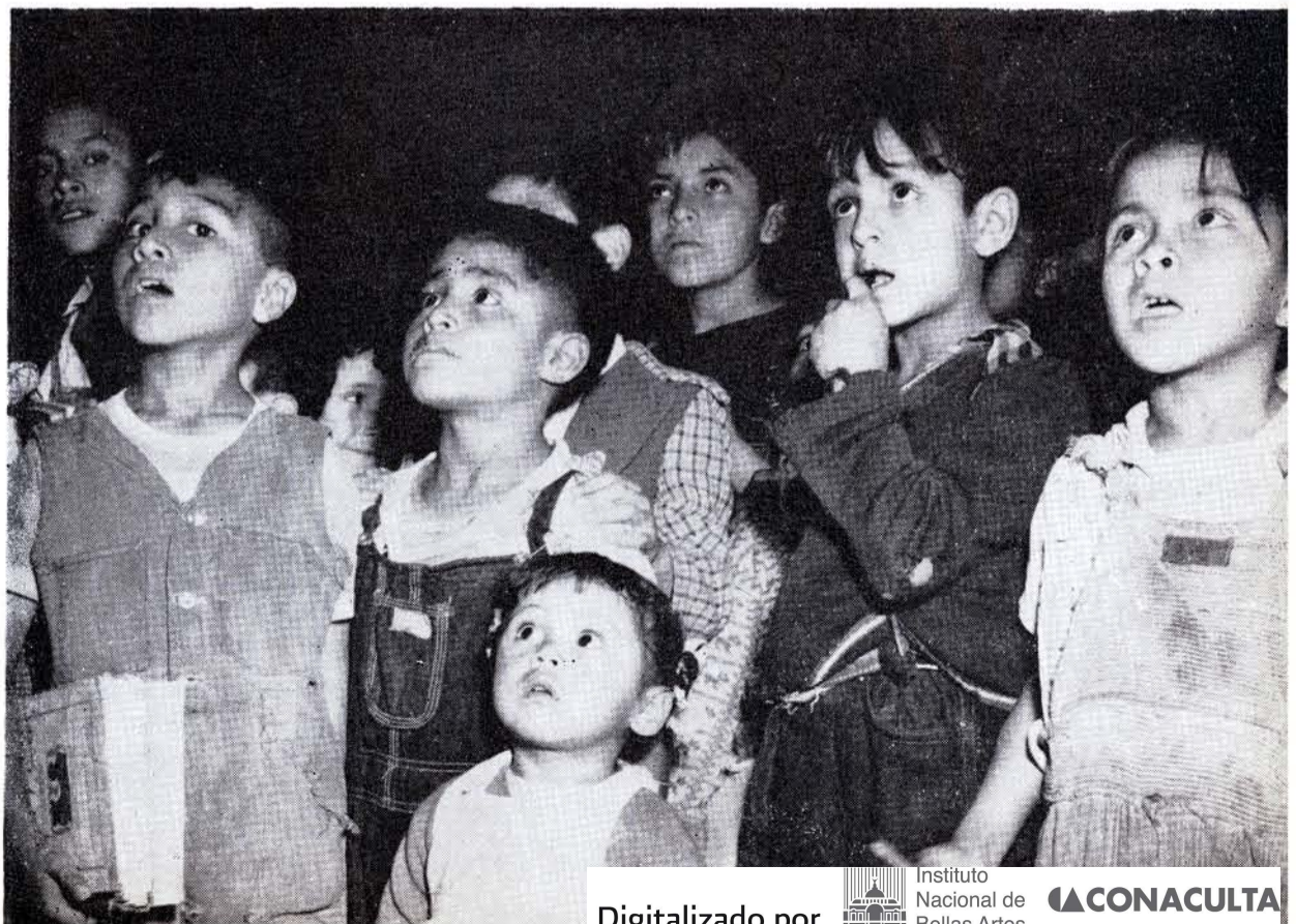
EL TEATRO Guiñol actúa en los jardines de niños y en las escuelas del D. F.