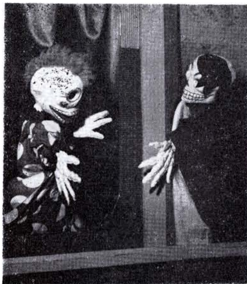
UN GRUPO de Guiñol está integrado por dos hombres y dos mujeres...

En atención a la profunda significación de carácter educativo y cultural de los grupos de teatro guiñol , el Lic. Miguel Alvarez Acosta, director general del INBA, dispuso que en terrenos adyacentes al Auditorium Nacional se erija el local en que habrán de desenvolverse todas sus actividades, y el cual cuenta con una sala de espectáculos, dotada de magnífico escenario, salas para exposiciones, aulas para impartir clases y los talleres indispensables para su funcionamiento. Las obras se encuentran muy adelantadas y en los meses venideros se efectuará su inauguración oficial.