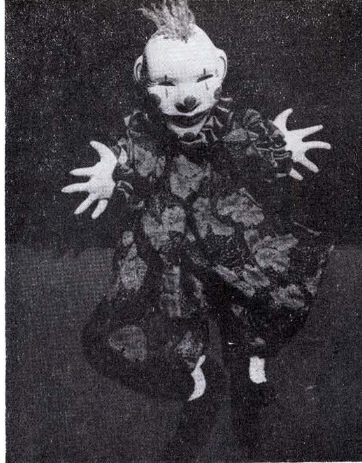
EL SEÑOR Guiñol es el muñeco más popular entre los niños de las escuelas...