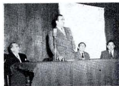
SALÓN DE ARQUITECTURA